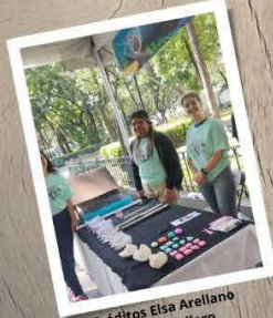
Créditos Elsa Arellano y Liz Caballero