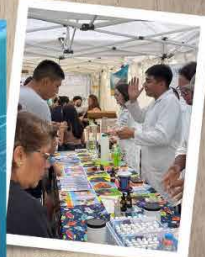
Créditos Jorge Cruz