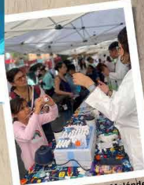
Créditos Adriana Meléndez