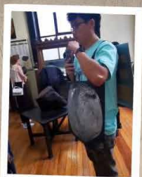
Créditos Karina Cervantes