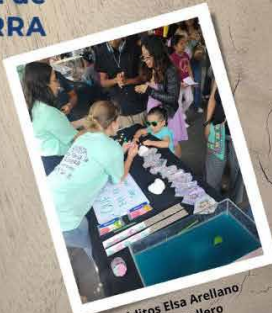
Créditos Elsa Arellano y Liz Caballero